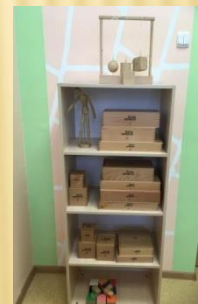
Дооборудование кабинета педагога-психолога