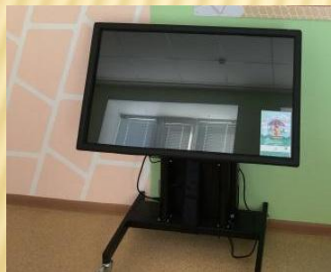
Оборудование кабинета логопеда

Адрес: Республики Татарстан, г.Елабуга, ул. Советская, д.4