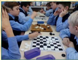
Шахматно-шашечный клуб «Белая ладья»