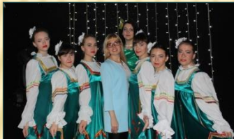
Хореографическая студия «Чародеи»