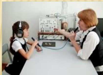
Дооборудование кабинета дефектолога специальной электроакустической аппаратурой