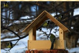
Национальный парк «Нижняя Кама»