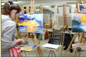
Детская художественная школа имени И.И.Шишкина